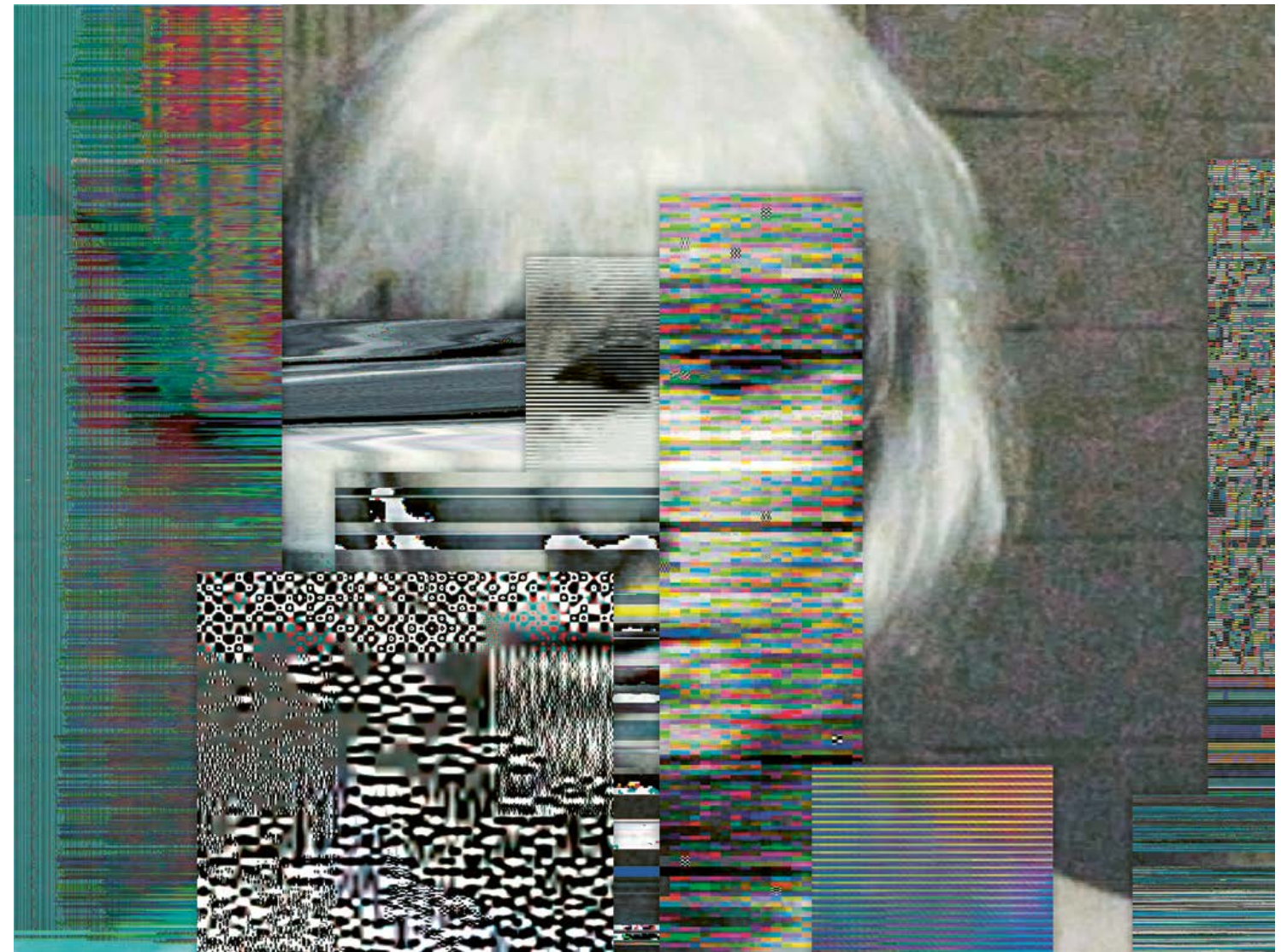
JODI, ASDFG,1999, Website (HTML),1-Kanal, kein Ton, Dauer: unendlich • website (HTML), single-channel, no sound, duration: infinite, Leihgabe der Künstler:innen • loan from the artists [Bildschirmfotos • screenshots]